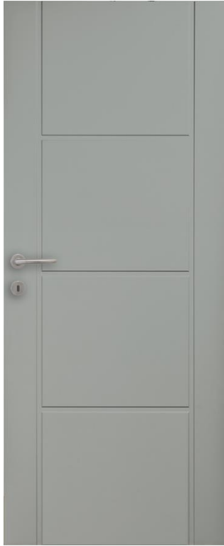
PORTE A PEINDRE DESIGN F 951