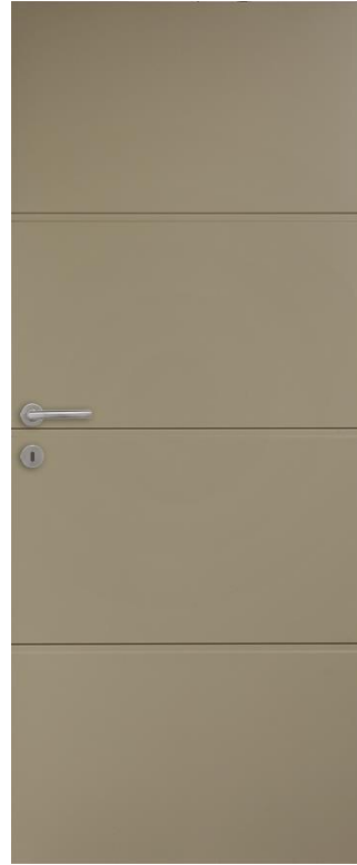
PORTE A PEINDRE DESIGN F 954